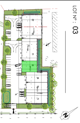
PLAN DE PRÉCOMMERCIALISATION